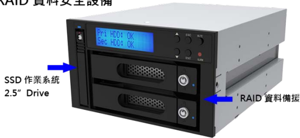
(1) 2.5" SSD 作業系統 + RAID 資料備援