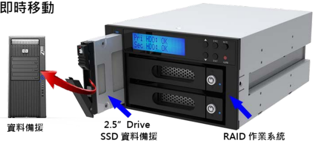
(2) RAID 0/1 作業系統 + 2.5" 附加移動儲存設備